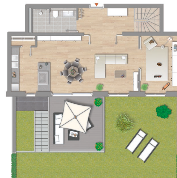
EG Alternative Büro